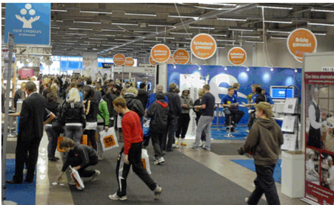
Personerna på bilden ingår ej i arbetet.

Gymnasievalet är en process som startar första terminen i årskurs 9 med mässor, studiebesök och öppna hus på olika skolor.