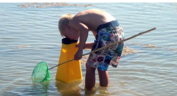
Tångräkan – en strandskola och upptäcksresa i havsmiljö för barn under Västerhavsveckan.

Intresset för att vara medarrangör, med stöd från miljönämnden, var stort och utvärderingen visar på ett omtyckt arrangemang. Program och bildreportage från Västerhavsveckan (som återkommer år 2009) finns på www.vasterhavsveckan.se . ■