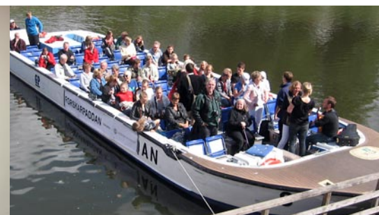
Vilka främlingar invaderar haven runt Väst-kusten? Fryser fiskar och kan de känna smärta? Det fick de som åkte med på ”Forskarpaddan” under Västerhavsveckan veta då forskare från Göteborgs universitet föreläste.