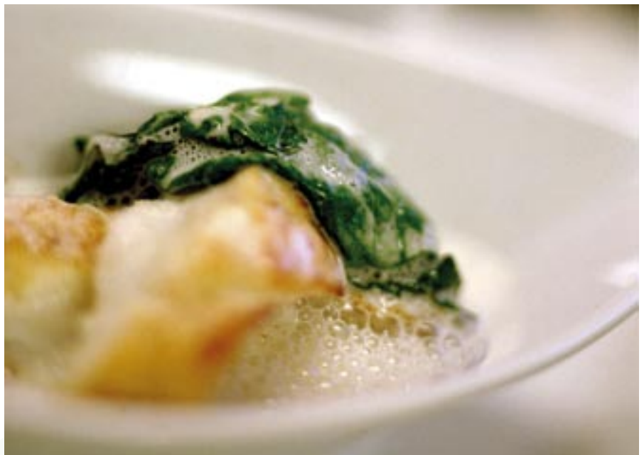
En god måltid lagad av ekologiska råvaror. Västra Götalandsregionen arbetar hårt för att öka andelen ekologiska livsmedel i de egna verksamheterna.

Man kan besöka vår webbplats www.miljobron.se . Där finns både information om verksamheten och kontaktuppgifter till oss verksamhetsledare i Göteborg och Fyrbodalen. ★