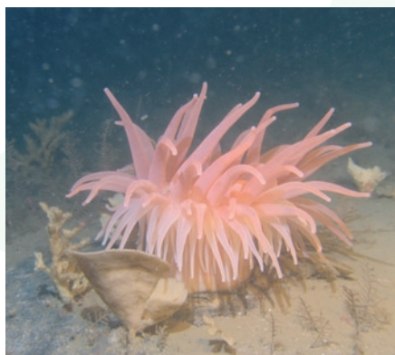
Sjöanemon på Skagerraks botten.

Ett av projektets mer uppseendeväckande resultat är att man har kunnat fotografera havsbotten på stora djup och