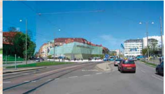
Illustrationen visar hur en framtida station vid Korsvägen skulle kunna se ut. Men ännu är inga beslut om utformningen klara.