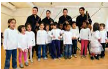
Musikaliskt utbyte. Förskolebarnen sjunger sången "Mama Lola" på spanska för medlemmarna i Simón Bolívar Youth Orchestra.