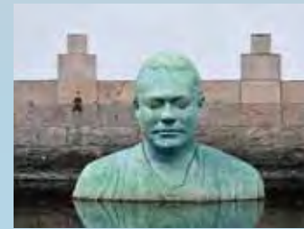
Bodhi av Fredrik Wretman

Öppettider: tisdag och torsdag, 11-20, onsdag, fredag-söndag, 11-17, måndagar stängt Tel. 033-35 76 72 Fri entré