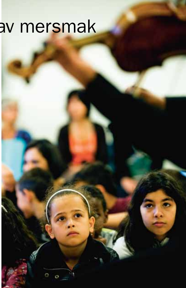
Framtidens musiker? Ungdomsorkestern från Venezuela väckte stort intresse och många elever testade deras stråkinstrument efter konserten.