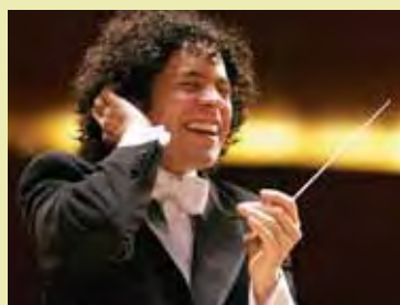
Gustavo Dudamel, initiativtagare till El Sistema i Hammarkullen.

startades av politikern och musikern José Antonio Abreu i Venezuela för drygt 30 år sedan. Syftet är att ge barn och ungdomar möjlighet att utvecklas genom att spela musik tillsammans. Musicerandet ska fungera som ett skydd mot att hamna i sociala svårigheter. Gustavo Dudamel har själv sin musikaliska bakgrund i El Sistema.