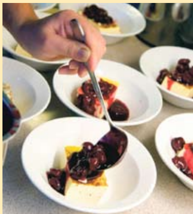
Kalvdans – en rätt som väcker smakminnen