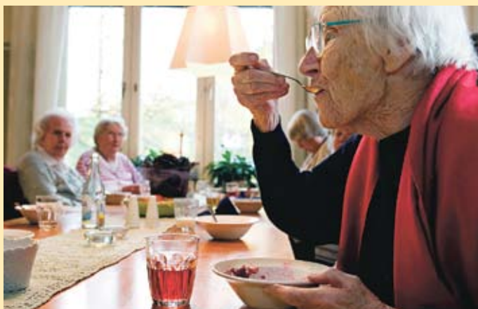
Pensionärerna på Änggårdsbackens äldreboende låter sig väl smaka av kalvdansen.