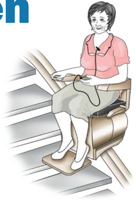
För den som vill bo kvar hemma kan bostaden behöva anpassas.