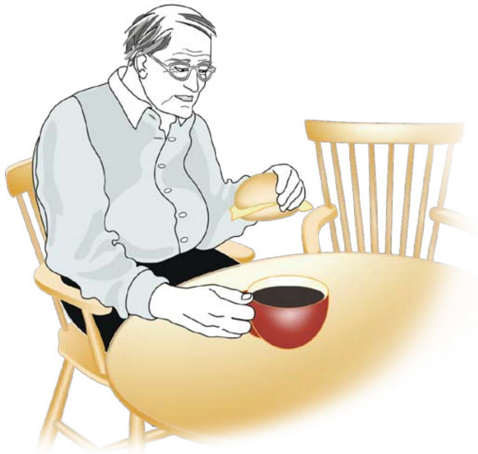
Räcker det att slarva med maten för att man ska få hemtjänst, eller vad gäller egentligen? Kontakta biståndshandläggaren för äldreomsorgen i din kommun så får du veta mer.