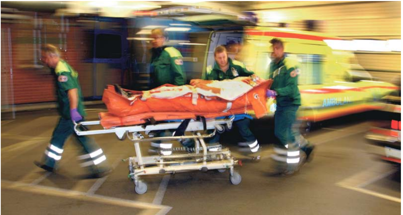
Den som är svårast sjuk får vård först. Det gäller oavsett om du kommer med ambulanstransport eller sitter i väntrummet på akutmottagningen.