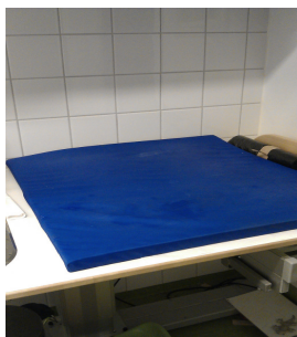
Blå dyna skötbord

*Bajsklocka är en klocka som barnen ringer på när de behöver hjälp på toaletten På Fsk 1 rengörs dörrhandtag dagligen med ytdesinfektion.