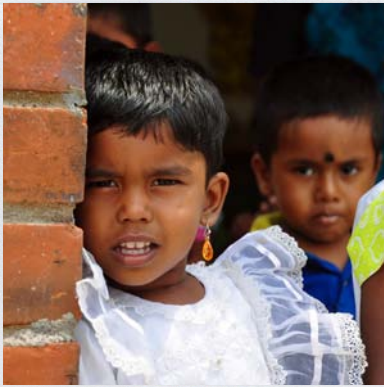
Förskola på textilfabrik, Indien