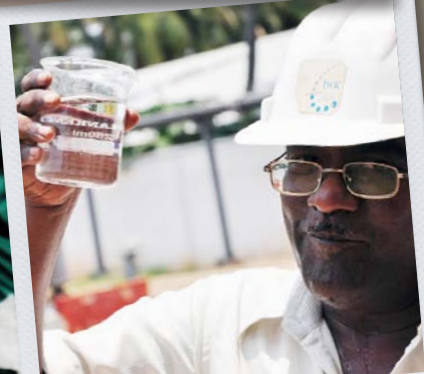
Vattenreningsverk i Tirupur, Indien 2009