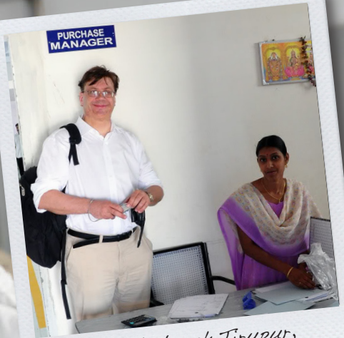
Fabriksbesök Tirupur, Indien 2009

Under 2010 går vi in i fas 3 i projektet Uppförandekod för leverantörer. Projektet skapar förutsättningar för alla landsting och regioner i Sverige att arbeta med socialt ansvarstagande genom en gemensam uppförandekod.