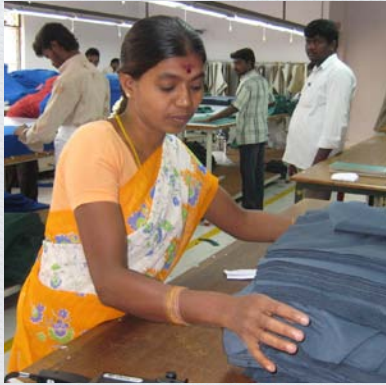
Fabriksbesök Tirupur, Indien 2009

Tirupur är Indiens textilhuvudstad. Här tillverkas många kända märkeskläder, men även patientkläder för sjukhusen i Stockholm, Skåne och Västra Götaland.