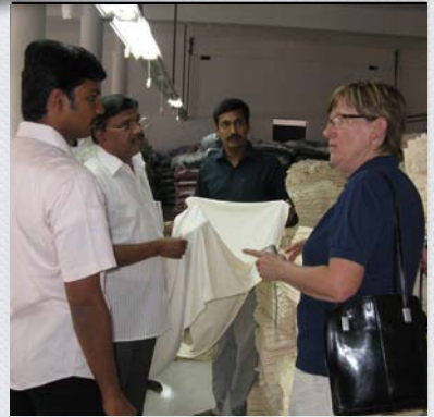
Fabriksbesök Tirupur, Indien 2009