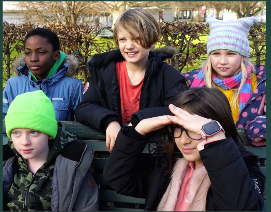
Lek för demokrati